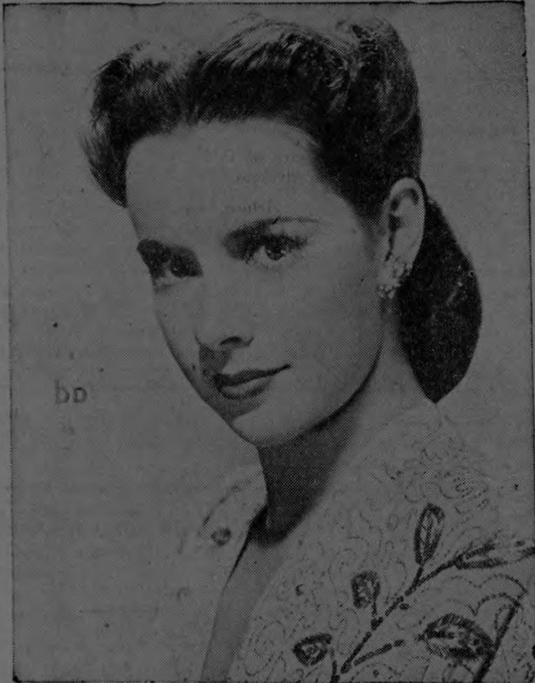
Siguiendo los consejos que en este artículo da el famoso experto de Hollywood, Max Factor Jr., tal vez puedan sus ojos mostrar la seductora expresión de los de la adorable estrella Susan Peters.

La preocupación, la falta de sueño, el cansancio y el mal humor son declarados enemigos de la belleza femenina. También puede disminuir la atracción de esa belleza la exposición de los ojos a una luz demasiado fuerte, lo mismo que la falta de lentes apropiados cuando un defecto visual requiere que se usen.